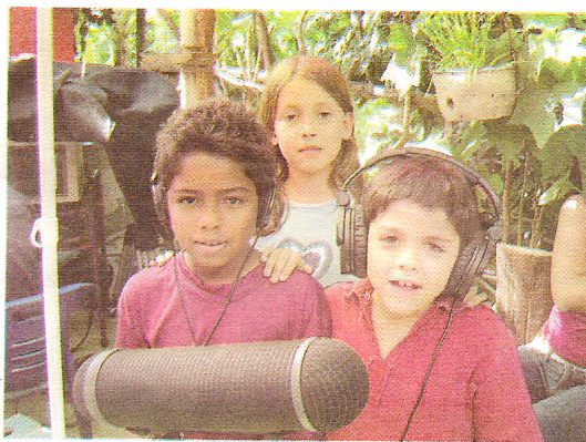
La participación de los niños le dio un toque de ternura al largometraje

“ Lo mejor para que no te atrapen es que nunca digas tu nombre de verdad ”