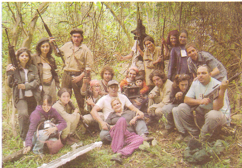
Elenco y creadores de Postales de Leningrado