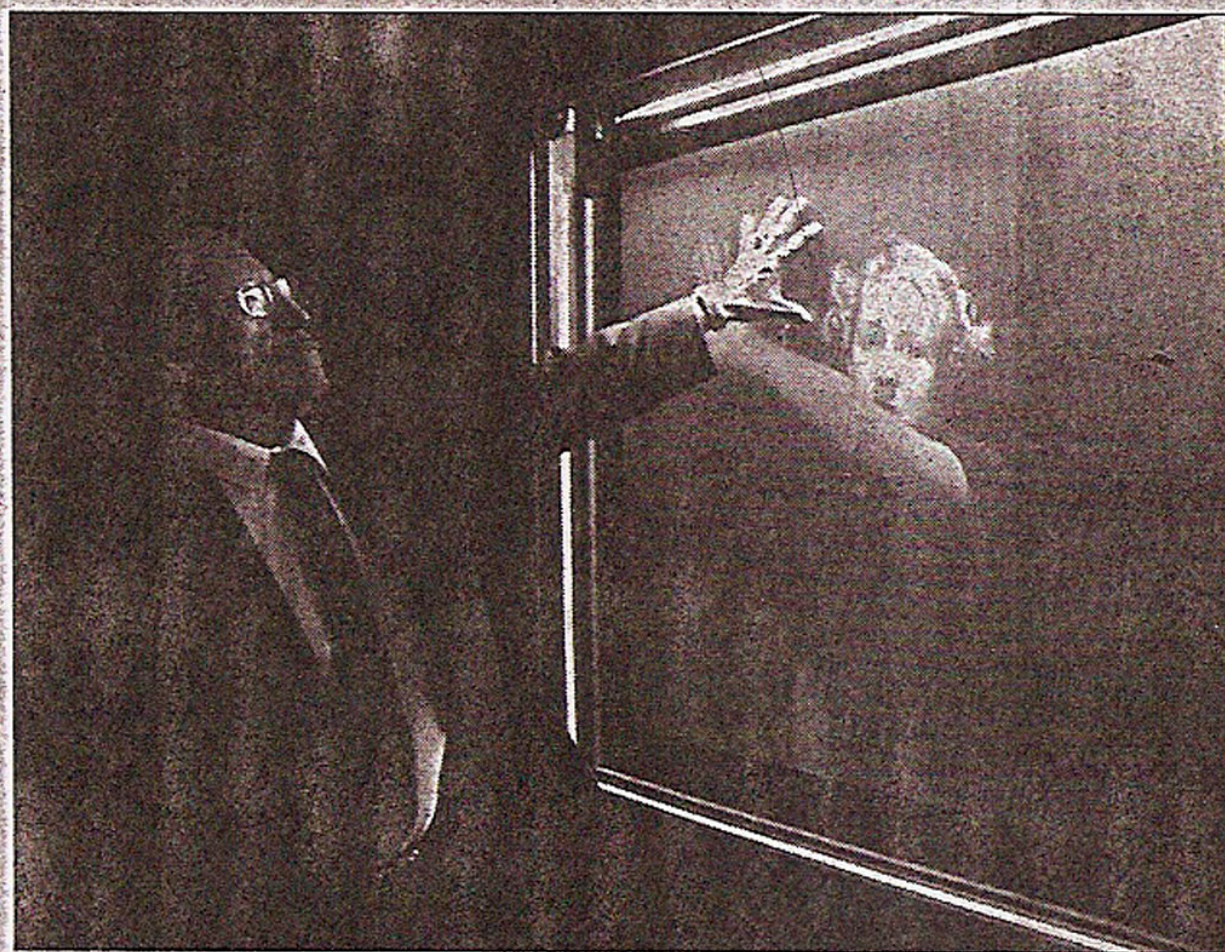
Pieza incluida en la muestra que alberga el Laboratorio de Arte Alameda ■ Guillermo Sologuren

■ Luego de presentarse en el Arco 2005, de Madrid, se exhibe en el Laboratorio de Arte Alameda